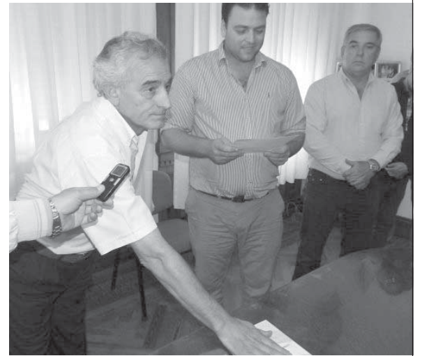
Jorge Zotti, el nuevo Subsecretario de seguridad al tomar juramento.

Confiamos plenamente en Jorge, en su capacidad y en las autoridades policiales locales para seguir instrumentando las políticas de seguridad que hemos diagramado, así como en las áreas de tránsito y en la de Defensa Civil" cerró el intendente.