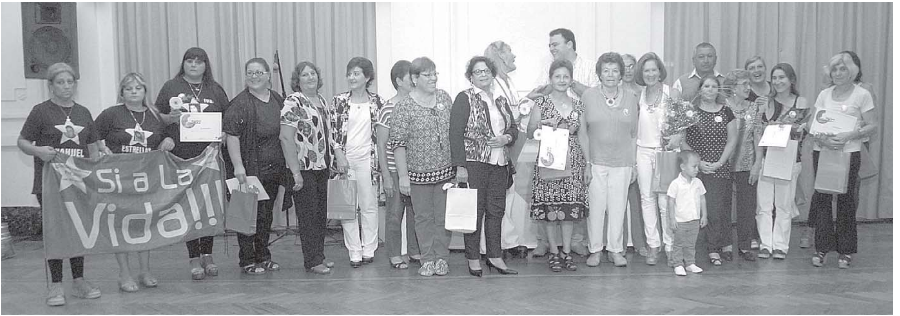
CIERRE DEL MES DE LA MUJER